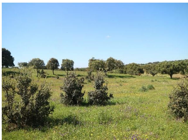
Regeneración natural en finca Defesinhas (Elvas, Portugal)

Las dehesas bajo pastoreo rotacional también presentaron una mayor riqueza de especies de plantas y una mejor calidad y productividad del pasto.