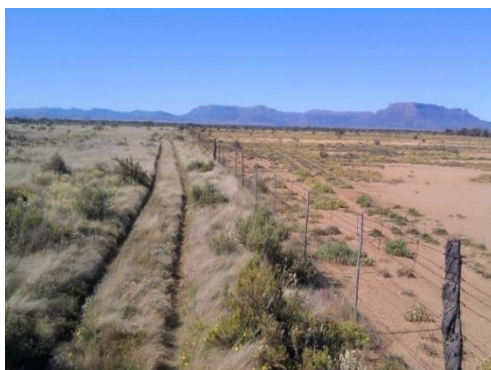
Finca bajo pastoreo rotacional adaptativo (Izquierda) y bajo pastoreo continuo (derecha) en África.. Savory Institute

El pastoreo rotacional adaptativo se puede implementar en cualquier ecosistema, sin que haya una restricción climática o ambiental.