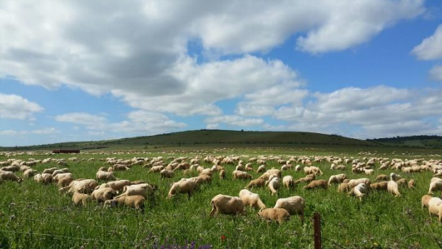
Pastoreo rotacional adaptativo en la finca Mundos Nuevos (Badajoz)