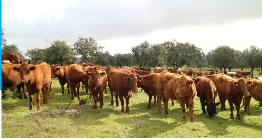
Pastoreo rotacional adaptativo en finca Defesinhas (Elvas)