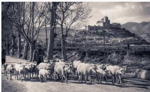
Caravaca años 50. Carretera a Murcia.

Se estima que existen en España unos 125.000 kilómetros de Vías Pecuarias, que suponen una superficie mayor a la de la isla de Mallorca. Son unos terrenos públicos que, junto a caminos y sendas, representan una densa retícula viaria en forma de telaraña que conecta espacios naturales, permite el movimiento del ganado y el tránsito de personas.